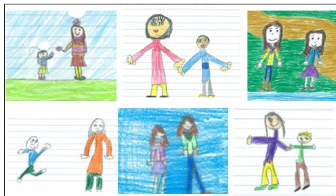
Fig. 3 – Excertos de alguns DC