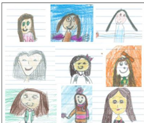
Fig. 2– Excertos de alguns DC

Nessas produções é possível perceber, pela representação que fazem do adulto, algumas das características do mesmo (físicas e psicológicas) que são referidas nos seus textos. Assim, os desenhos parecem funcionar como uma forma de reforçar esses traços que definem a docente. Os traços da personalidade e da postura da docente são identificáveis sobretudo através de um rosto sorridente ou da forma de estar afável e amigável (ver Fig.2). Simultaneamente, os desenhos permitem expressar a ligação afetiva existente na relação entre os sujeitos. O estar de mãos dadas, o correr em direção à professora, os sorrisos dos alunos nas suas auto-representações e os corações são alguns dos elementos gráficos que facilitam a “leitura” de uma relação que se poderá interpretar como afetiva, o que coincide com o discurso das crianças, já analisado (ver Fig.3 e Fig. 4).