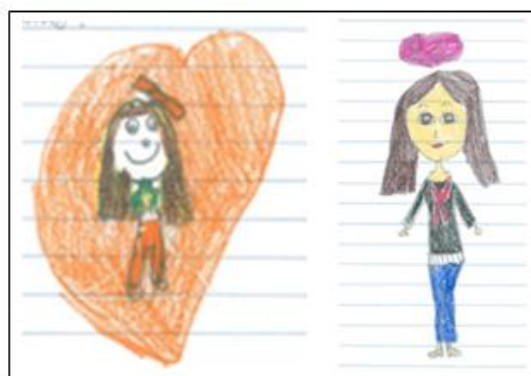
Fig. 4 – Excertos de alguns DC

Note-se ainda que o adulto, ora representado sozinho ora acompanhado pela criança, surge, nessas representações, inserido em cenários que se assemelham à realidade vivida pelas crianças.