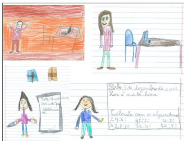
Fig. 5 – Excertos de alguns DC

Elementos do contexto escolar são, deste forma, incluídos nos seus desenhos (ver Fig. 5). Tratando-se de ilustrações que acompanham os seus textos acerca da professora R., parece fazer sentido o cuidado, ou a necessidade, que alguns alunos tiveram em representar elementos que possibilitam identificar com facilidade o quotidiano profissional da personagem retratada.