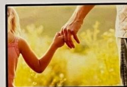
DIREITO A SER PROTEGIDA DE VIOLÊNCIA, EXPLORAÇÃO E NEGLIGÊNCIA