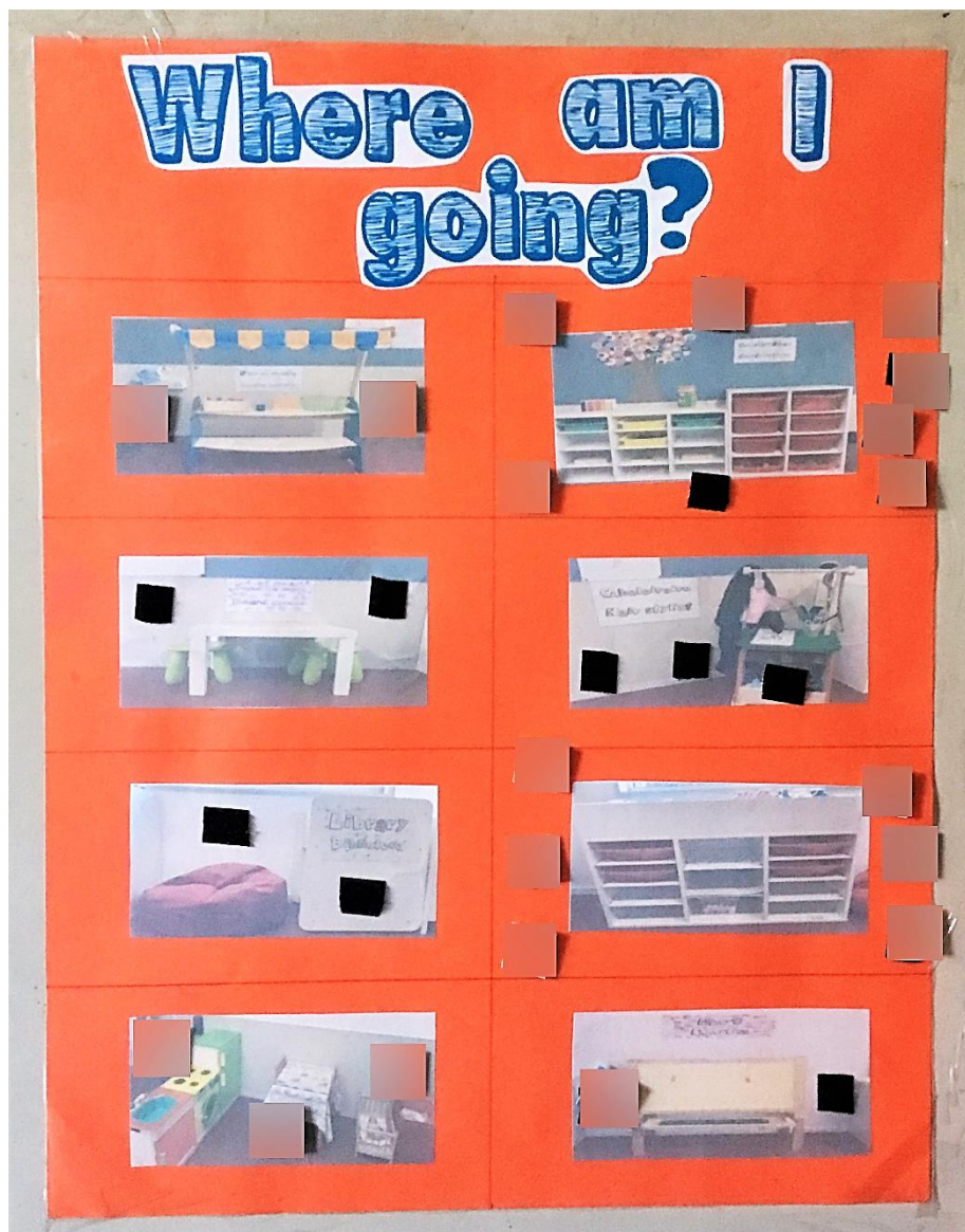
Fotografia 2. Quadro das Áreas.