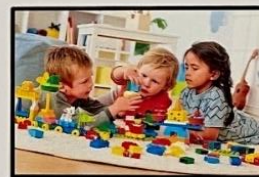
DIREITO A BRINCAR