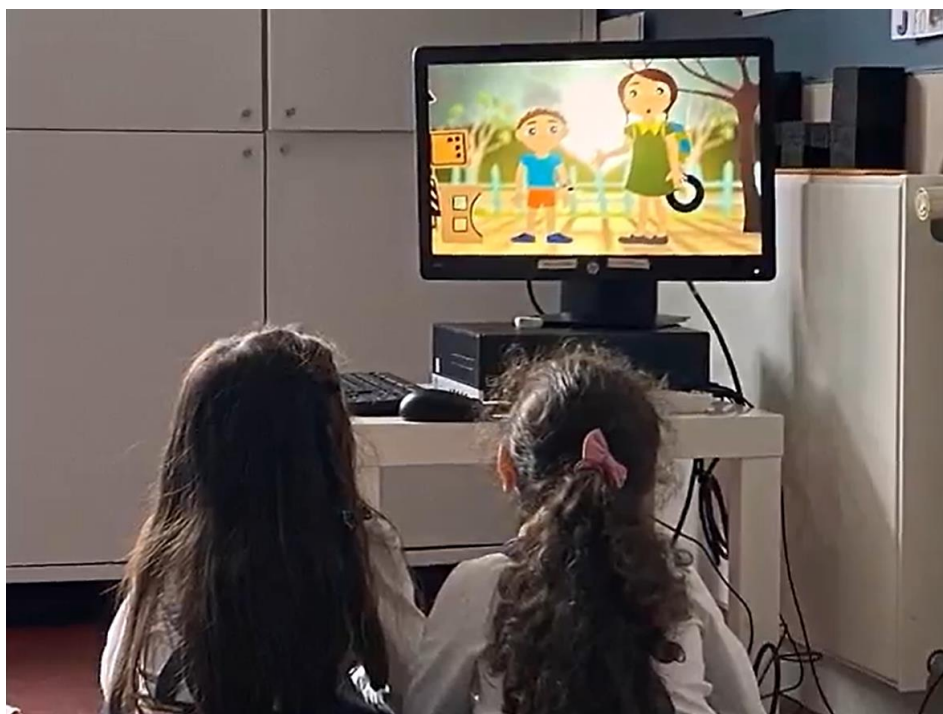
Figura 1. Visualização de um vídeo sobre os Direitos da Criança.

após a finalização da visualização, a estagiária colocou algumas questões às crianças com o intuito de provocar diálogo e reflexão acerca da temática abordada. A finalidade desta provocação passou por visar potenciar a partilha de ideias e questões relativas ao tema a explorar, tendo por base os conhecimentos obtidos através do vídeo, bem como possíveis conhecimentos prévios das crianças. Com efeito, muitas crianças foram capazes de recordar e explicitar algumas informações. Após esta discussão, a estagiária procedeu à explicação da CDC, igualmente mencionada no vídeo visualizado, bem como à explicação do conceito de ‘direito’.