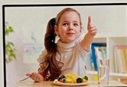
DIREITO A DESENVOLVER-SE COM SAÚDE ATRAVÉS DE ACESSO A COMIDA SAUDÁVEL, ÁGUA POTÁVEL E ASSISTÊNCIA MÉDICA