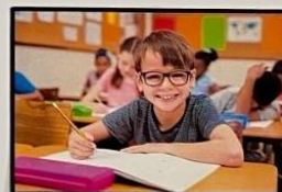
DIREITO A UMA EDUCAÇÃO GRATUITA E DE QUALIDADE