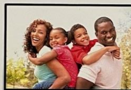
DIREITO A CRESCER NUM AMBIENTE DE AMOR, SEGURANÇA E COMPREENSÃO