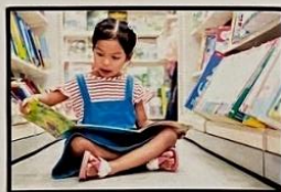
DIREITO A RECEBER E PROCURAR INFORMAÇÃO