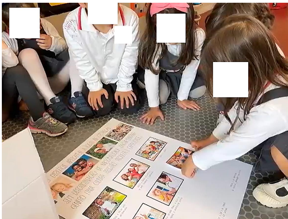
Figuras 4 e 5. Elaboração de um cartaz sobre os Direitos da Criança.