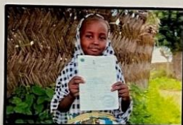
DIREITO A TER UM NOME E UMA NACIONALIDADE

SEM DISCRIMINAÇÃO DE NACIONALIDADE, LÍNGUA MATERNA, GÊNERO, ETNIA, CULTURA, RELIGIÃO, RIQUEZA E CAPACIDADES.