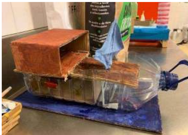
Figura 6 - Barco Rabelo