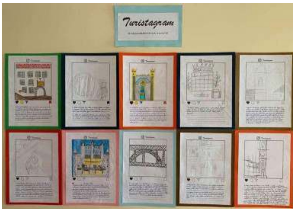
Figura 1 - Turistagram