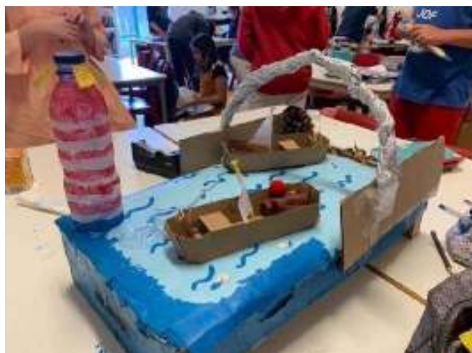
Figura 4 - Rio Douro