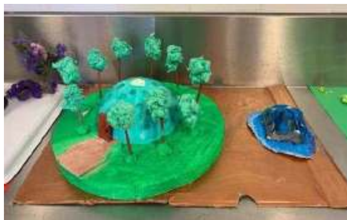
Figura 3 - Palácio de Cristal