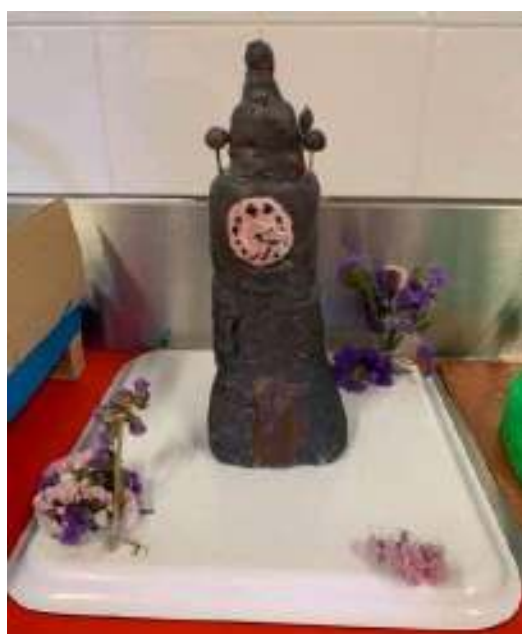
Figura 5 - Torre dos Clérigos